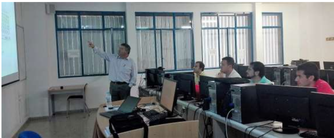
Ilustración 6: Curso de simulación de procesos en la EPS de Algeciras