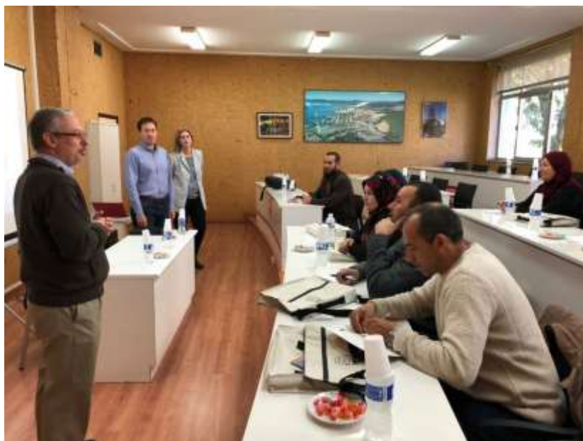
Ilustración 19: La cátedra colaboró con el Aula Universitaria del Estrecho en la organización de la visita realizada por profesores de una universidad de Argelia el 14 de noviembre.