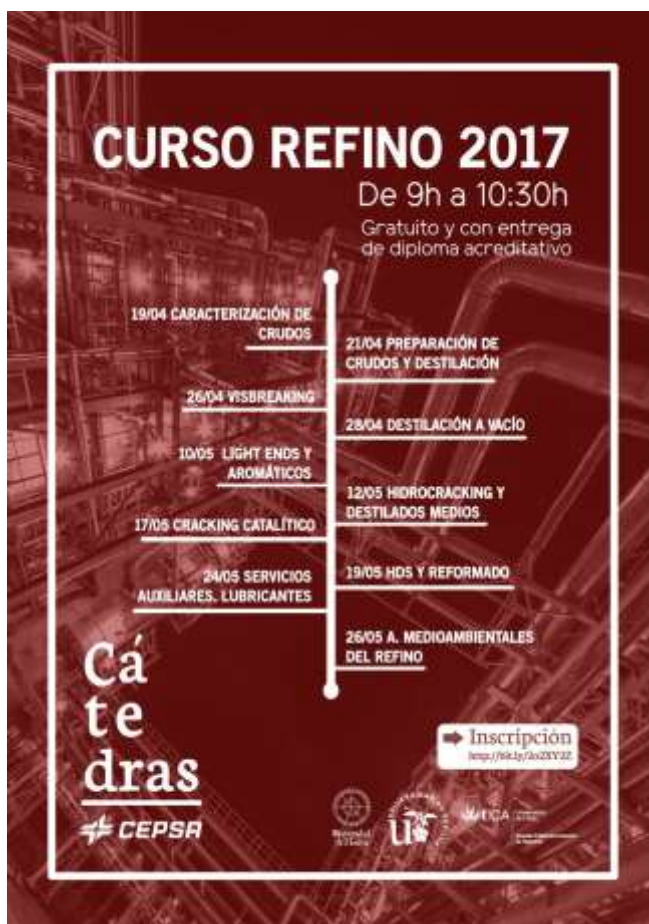
Ilustración 5: Cartel anunciador del seminario en refino.