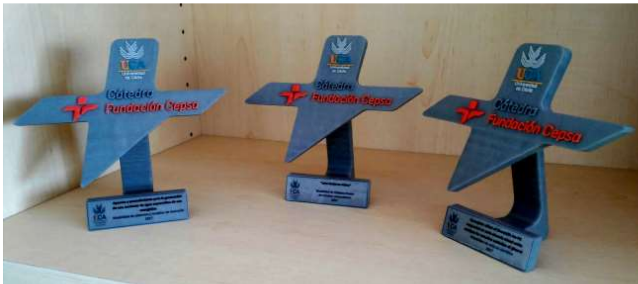
Ilustración 10: Estatuillas del premio, fabricadas mediante impresión 3D en la división de Fabricación aditiva de la UCA.

La Cátedra Fundación Cepsa ha querido que la innovación esté también presente en los trofeos de los premios que conceden. Estas estatuillas han sido creadas mediante una de las tecnologías más avanzadas de fabricación: la fabricación aditiva. Y en concreto con el proceso denominado CJP, que permite la impresión 3D a todo color de piezas de plástico flexible, robusto y reciclable. La Universidad de Cádiz dispone de una división de fabricación aditiva, que pone a disposición de investigadores, empresas y de toda la sociedad.