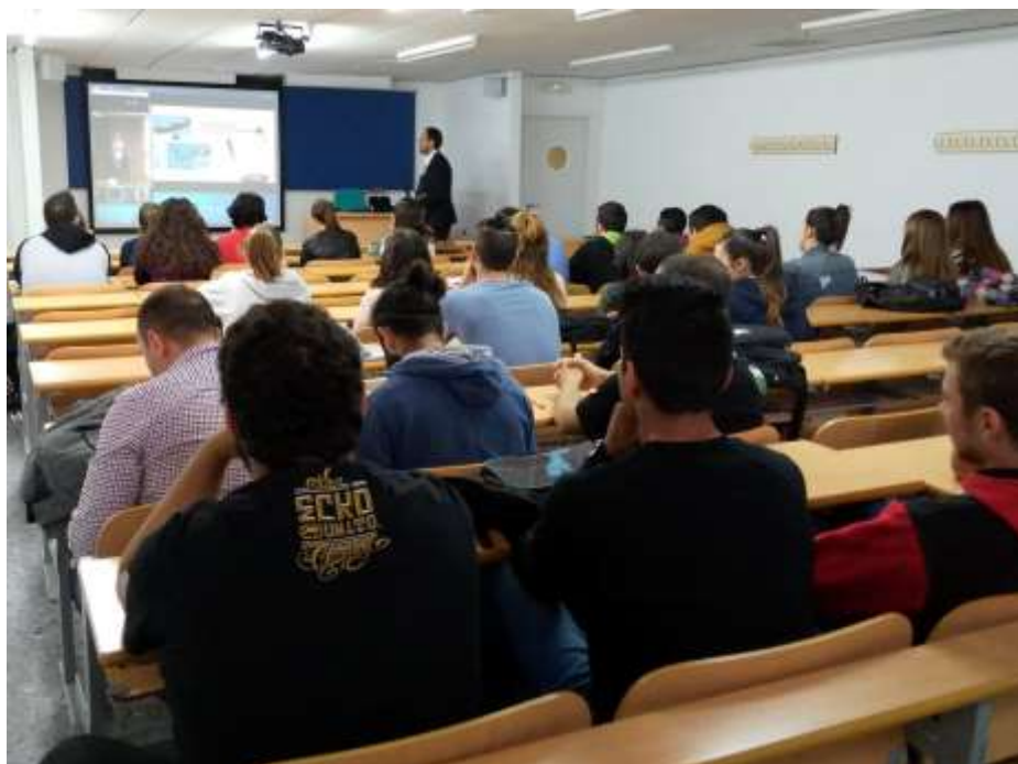
Ilustración 4: aula de la EPS de Algeciras durante el transcurso de una de las sesiones del seminario en refino del petróleo, mantenida por teledocencia.

Asistieron al menos a ocho de las sesiones 27 alumnos desde Algeciras y 14 desde Puerto Real, que recibieron un diploma acreditativo. La valoración de esta actividad por parte de los asistentes fue muy satisfactoria (9 sobre 10), como quedó registrada en los resultados de la encuesta de satisfacción que realizaron una vez finalizado el seminario.