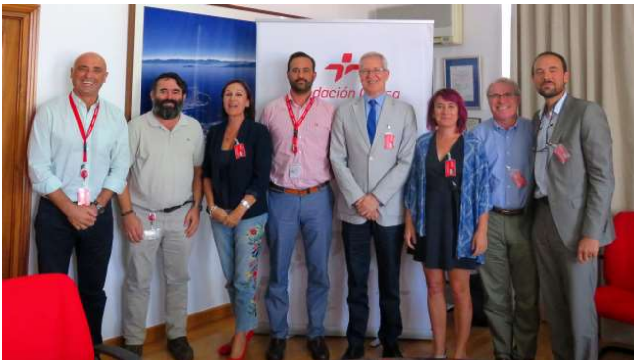
Ilustración 2: miembros de la comisión de seguimiento de la Cátedra Fundación Cepsa tras una de las reuniones mantenidas en 2017.