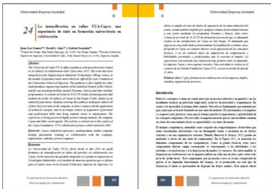
Ilustración 18: las primeras páginas del capítulo de libro publicado.